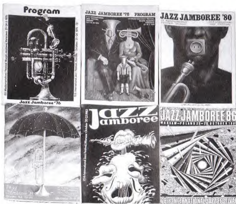
Programy varšavského Jazz Jamboree ze 70. a 80. let.

zájezd přes Jazzovou sekci, že jsou tam úžasné koncerty. To už jsem byl v tom svém jazzovém světě a najednou se jednoznačně řeklo, že nikde jinde v celém východním bloku, nikde neměl člověk šanci slyšet tak kvalitní jazz jako ve Varšavě na Jazz Jamboree. Logicky i k tomuhle mě přivedla Jazzová sekce.